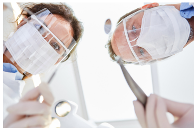
cod. 10 990 Visiera paraschizzi in PET, 1pz