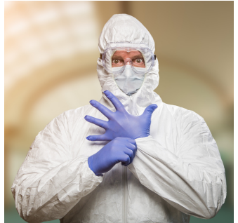
cod. 10 945 Tuta in TNT, 100gr/mq, con cappuccio e zip, 1 pz