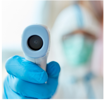
cod. 10 999 Termometro frontale ad infrarossi