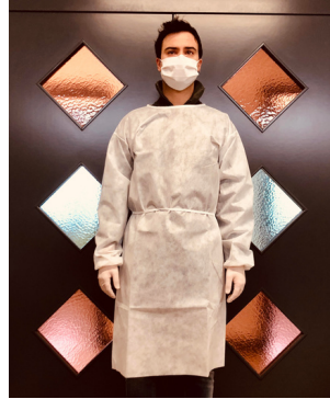
cod. 10 940 Camici in TNT, 70gr/mq, Taglia S/M o L/XL, 5 pz