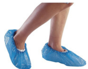
cod. 00 001 (ad esaurimento) Copriscarpe in polietilene, 10 pz